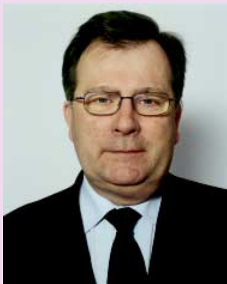
Beskæftigelsesminister Claus Hjort Frederiksen

Vi har lavet en udskrift af de udtalelser, der faldt i et interview få dage før valget