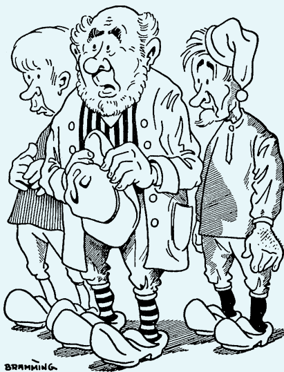
Vi kommer nok heller ikke på ferie i år.

I den søde juletid GIVER vi gaver, men det er ikke et ta' selv-bord for politikere, så lad os give dem en RØD tud, men ingen juledragt, for det ville ødelægge vores barnetro om godhed.